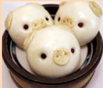
■豚ちゃん肉 まんじゅう 1個 350円 (税別)