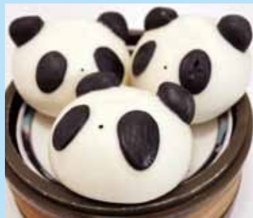
■パンダあん まんじゅう 1個 350円 (税別)