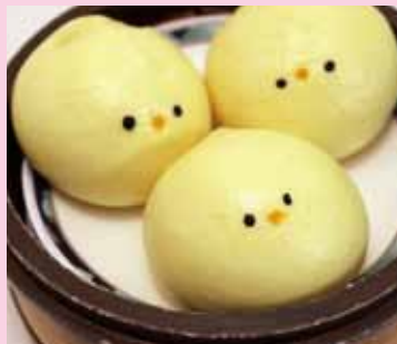
■ヒヨコカスタード まんじゅう 1個 350円 (税別)