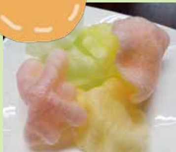
■エビせんべい 280円 (税別)