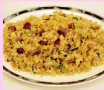
■ハーフチャーハン 450円 (税別)