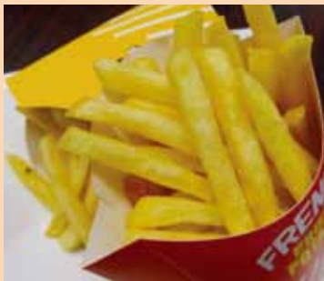
■ポテトフライ 1カップ 280円 (税別)