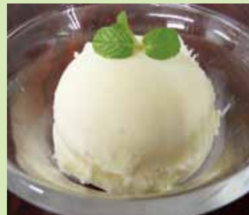
■バニラアイス 300円 (税別)